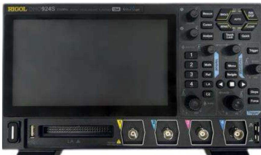
Рисунок 1 – Передняя панель осциллографов RIGOL DHO9ZZ

Для предотвращения несанкционированного доступа к внутренним частям осциллографов осуществляется пломбирование нижней панели специальными стикер-наклейками (рисунки 2, 3).