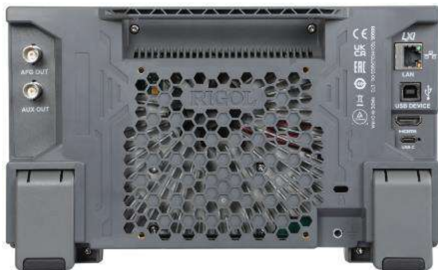
Рисунок 3 – Задняя панель осциллографов RIGOL DHO9ZZ для модификаций DHO914S и DHO924S