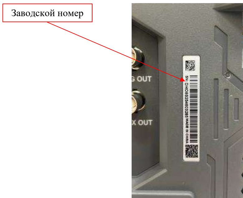
Рисунок 5 – Фрагмент задней панели осциллографов RIGOL DHO9ZZ