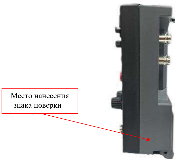
Рисунок 4 – Боковая панель осциллографов RIGOL DHO9ZZ